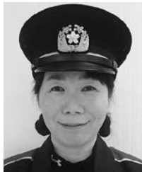
両角女性消防隊長