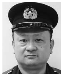
大和第五分団長 (第五区)