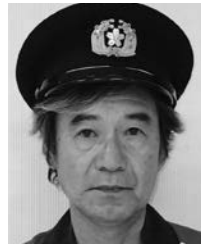
武居第二分団長 (第二区)