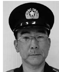
小口第三分団長 (第三区)