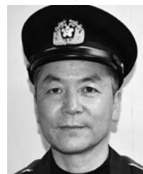
今井第六分団長 (第六区)